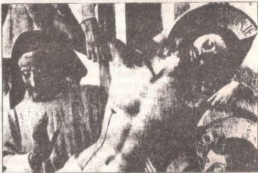
Beato Angelico: Deposizione dalla Croce (particolare) Firenze, Museo del Convento di San Marco

Il salmista aggiunge con struggente desiderio: "Di te ha detto il mio cuore: Cercate il suo volto; il tuo volto, Signore, io cerco" (Sal 26,8). Con la Sindone siamo tutti un po' veggenti. Veggenti del Volto e Corpo di Cristo. Adesso lo guardiamo come in uno specchio, lo vediamo nella fotografia che ci ha lasciato. Poi lo contempleremo faccia a faccia.