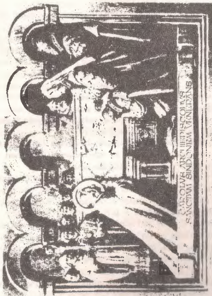
Togliatto Amatas. - San Carlo Borromeo venera la Sindone a Torino